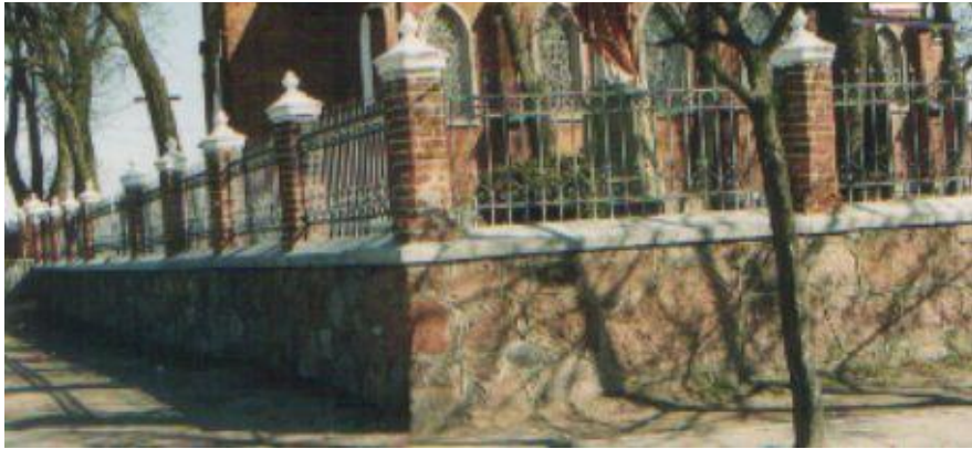
Byczynie XIX/XX wiek