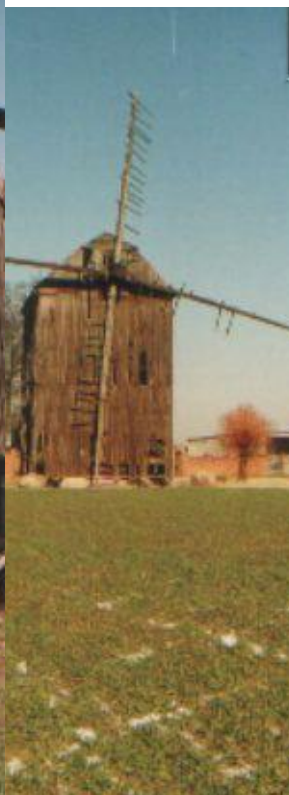
Wiatrak koźlak drewn. z 1 ćw. XIX w. i wiatrak paltrak 1914 r.