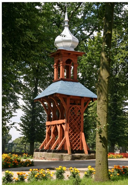
Krzywosądz - Neogotycka dzwonnica rok b. 1861

Jest to budowla neogotycka drewniana, o konstrukcji zrębowo-słupowej na fundamencie granitowym. W południowo-zachodnim narożu znajduje się głaz z wyrytą datą 1861. Prezbiterium dwuprzęsłowe, z objętymi bryła korpusu przybudówkami po bokach, ponad którymi znajdują się łoże kolatorskie. Korpus kościoła trójnawowy pseudohalowy, z przybudówką na osi mieszczącą kruchtę. Okna i przeźrocza nad wejściami ostrołukowe. Dach kryty blachą. Od wschodu czworoboczne wieżyczki, od zachodu nadbudowana kwadratowa wieża. Kruchta zakończona ażurową balustradą. Ołtarz główny, ambona, chrzcielnica i ławy kolatorskie z herbem Tępa Podkowa. W lewym bocznym ołtarzy obraz św. Antoniego z Dzieciątkiem, barokowy z XVII wieku, ponadto monstrancja barokowa z połowy XVIII wieku z cechą miejską Torunia, gotycki kielich z XV wieku. 5