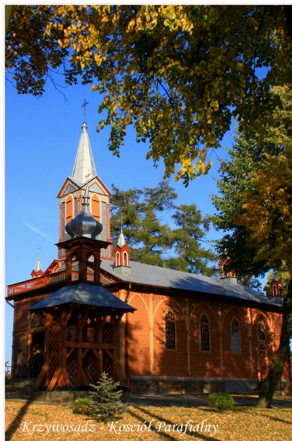
Krzywosądz - Kościół Parafialny