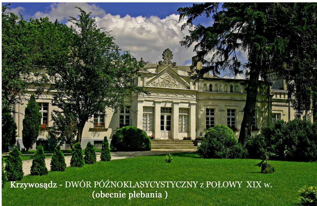
Krzywosądz - DWÓR PÓŻNOKLASYCYSTYCZNY z POŁOWY XIX w. (obecnie plebania)

Budowla murowana, parterowa, jedenastoosiowa, zwrócona frontem ku południowi, z ryzalitem na osi frontu i przybudówką od wschodu, łączącą korpus z czworoboczną dwukondygnacyjną wieżą – basztą. Dwór w ciągu kilku lat przebudowywano nadając mu charakter romantyczny, nawiązujący w swoim zdobnictwie do motywów średniowiecza.