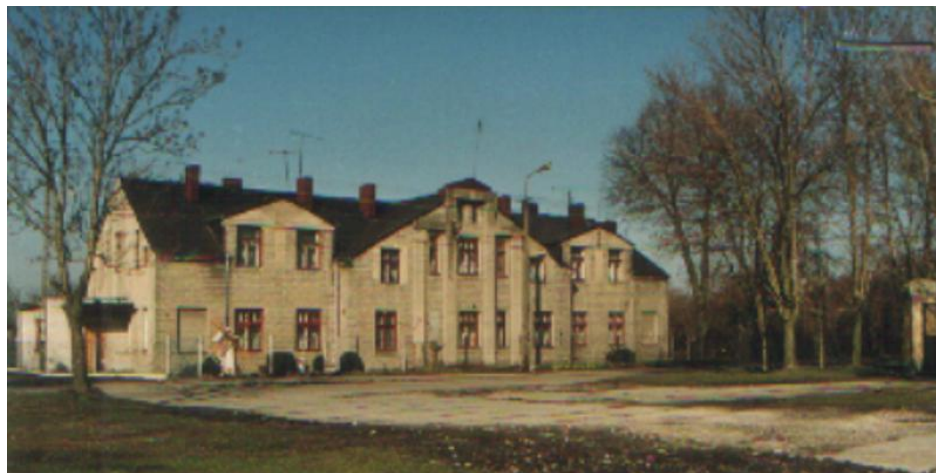
Szpital z zespołu cukrowni Dobrze, ul. Powstańców 1863r.

Wykaz obiektów objętych ochroną konserwatorską: