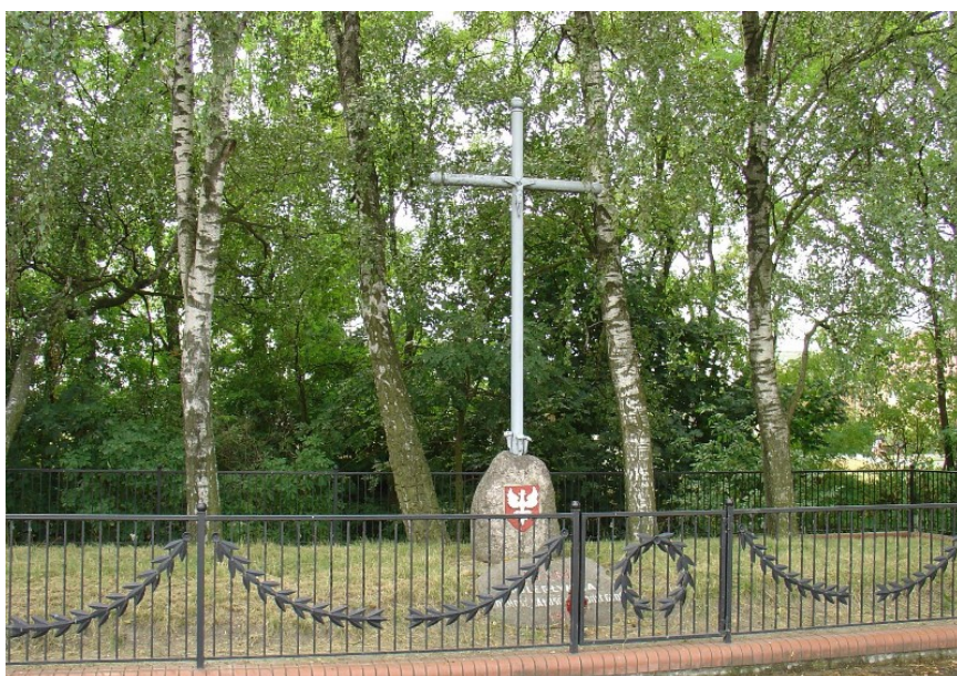
Mogiła Powstańców 1863r. w Dobrem