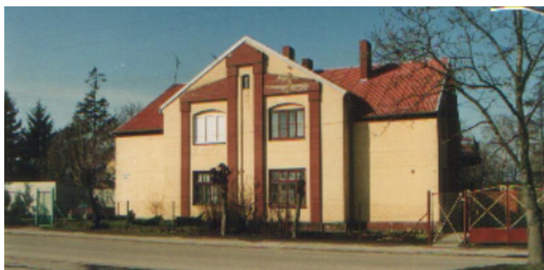
Dom urzędników III z zespołu cukrowni, Dobrze, ul. Powstańców 1863r.