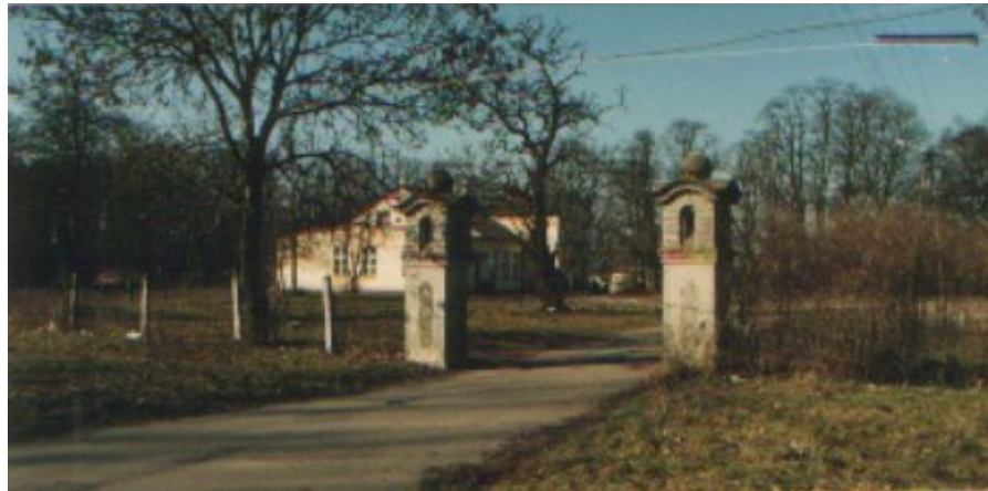
Dwór – brama wjazdowa