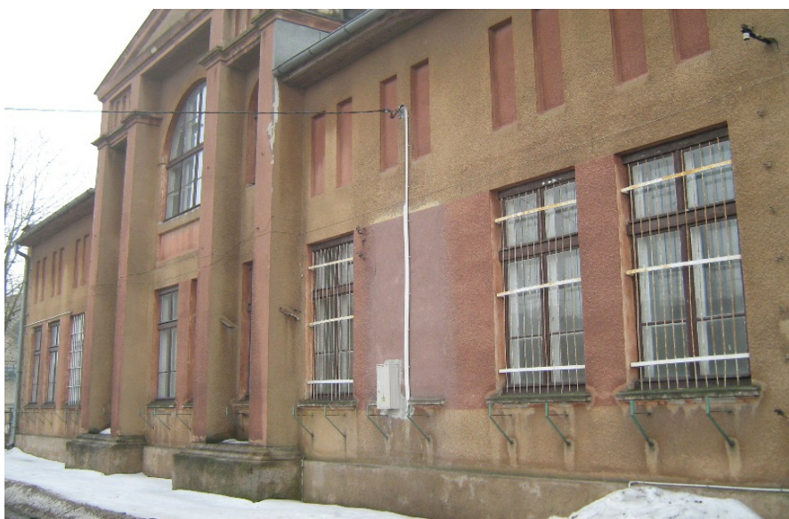
Budynek administracyjny murowany w okresie międzywojennym

jedna od strony podwórza gospodarczego, druga od strony prowadzącej do Radziejowa. W owym czasie obszar parku wynosił 4.31 ha.