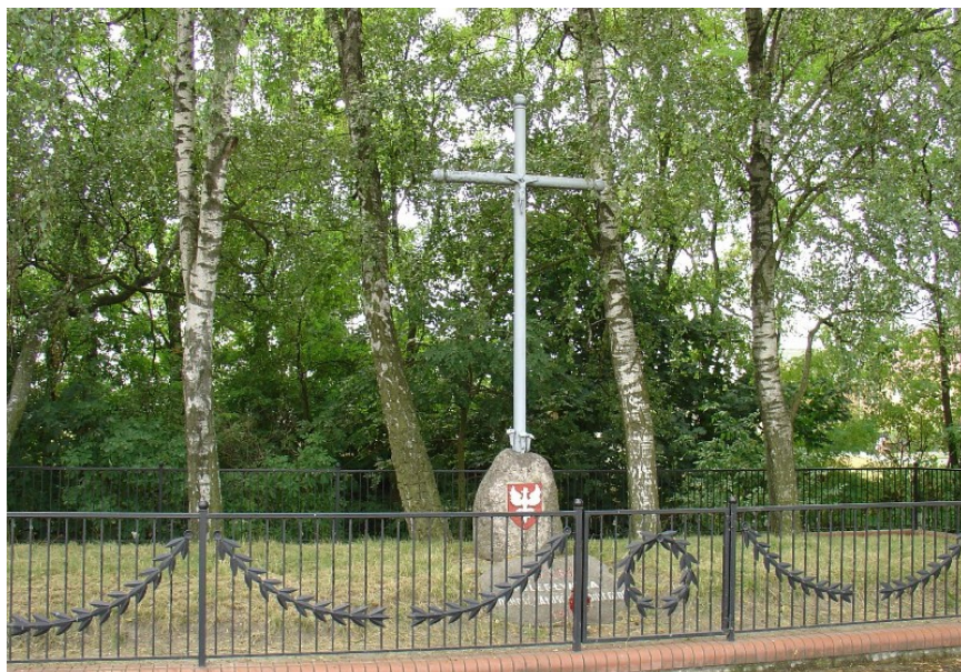
Mogiła Powstańców 1863r. w Dobrem