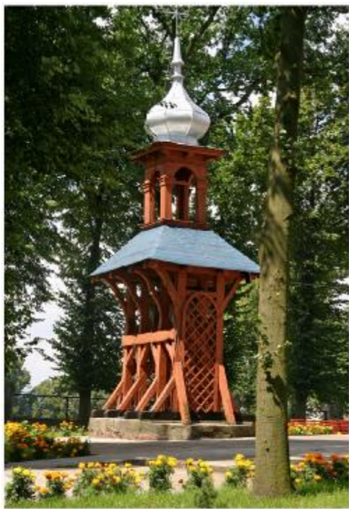
Krzywosądz - Neogotycka dzwonnica rok b. 1861