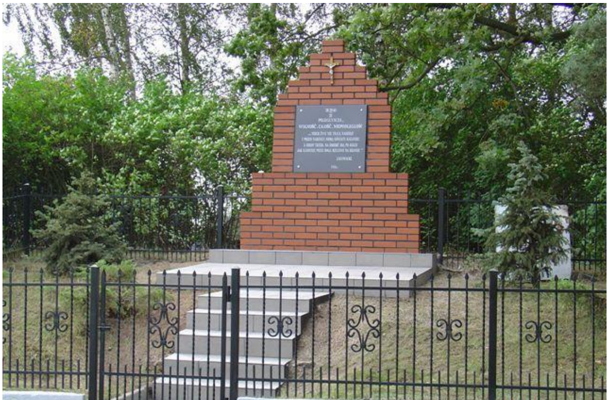
Pomnik w Krzywosadzy przy drodze do Bodzanowa

Poległym za wolność, Całość, Niepodległość niech żywi nie tracą nadziei i przed narodem niosą oświaty kaganiec, A kiedy trzeba, na śmierć idą po kolei jak kamienie przez Boga rzucające na szaniec, J. Słowacki 1916r.