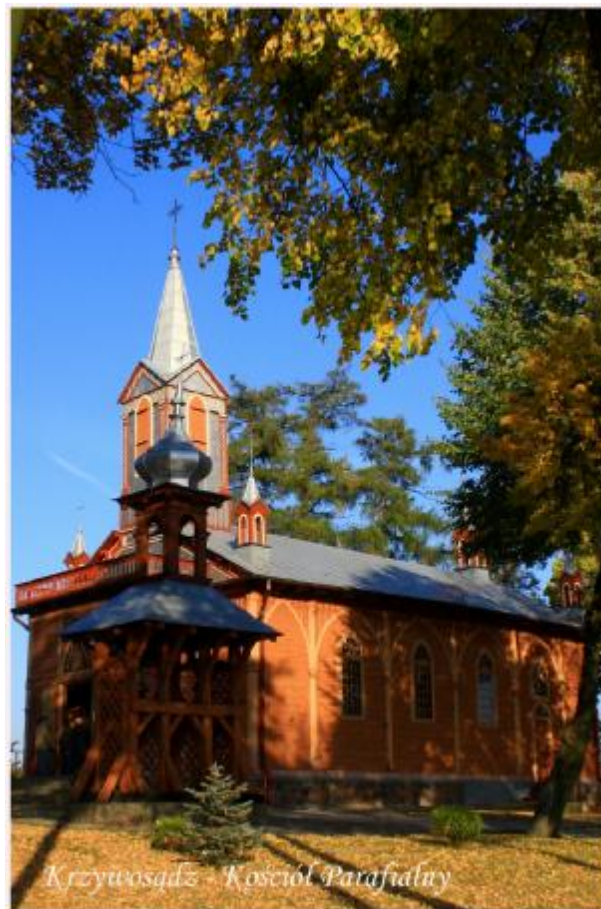
Krzywosądz - Kościół Parafialny